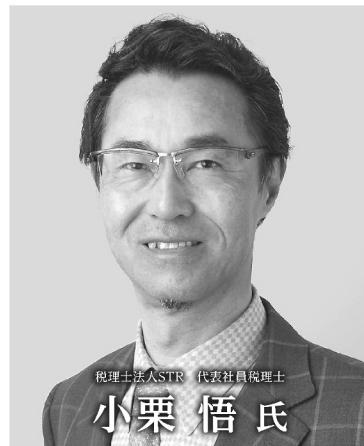
税理士法人STR 代表社員税理士